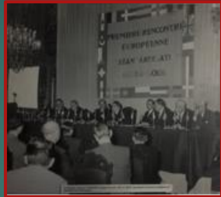
1ere rencontre Européenne de Standardisation, LYON, 22-25 juin 1955